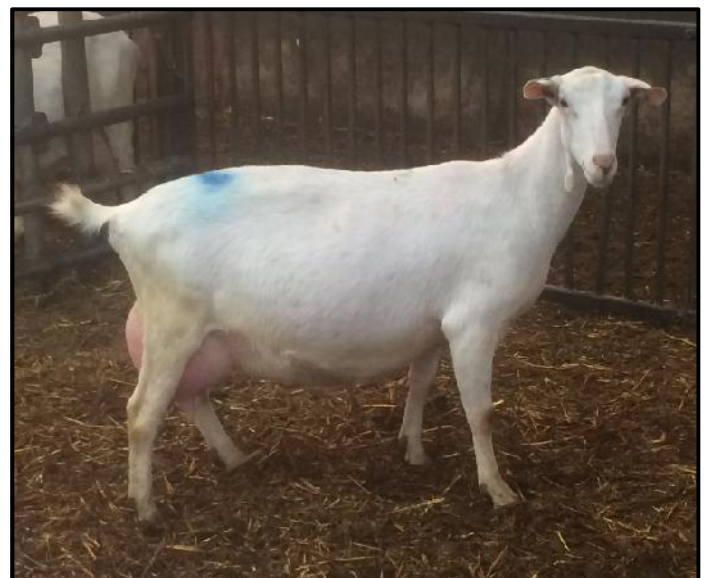
Zomaar even een mooi plaatje: Een geit uit een triple-a paring bij Familie Nootboom in Strijen

In deze nieuwsbrief weer veel informatie en veel leesplezier gewenst.