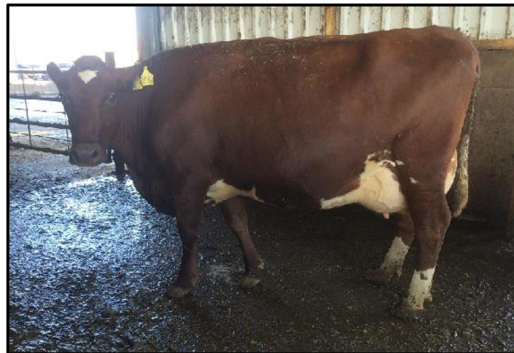
Een Kylian uit een Tulip die dit jaar meer dan 60 kg melk gaf.