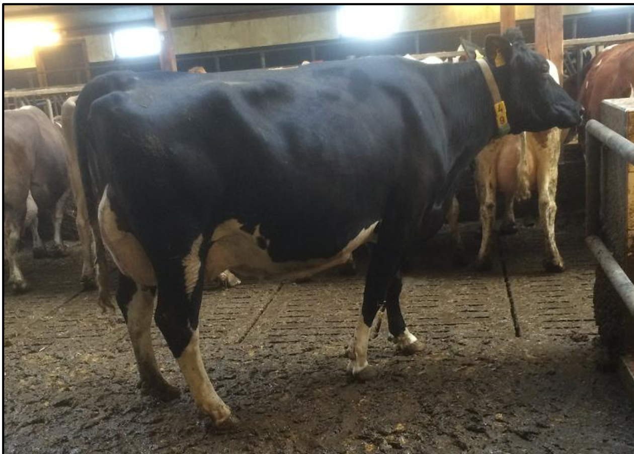
Zomaar een mooi plaatje: een oudmelkte Curtis uit een Minister in Oostenrijk.