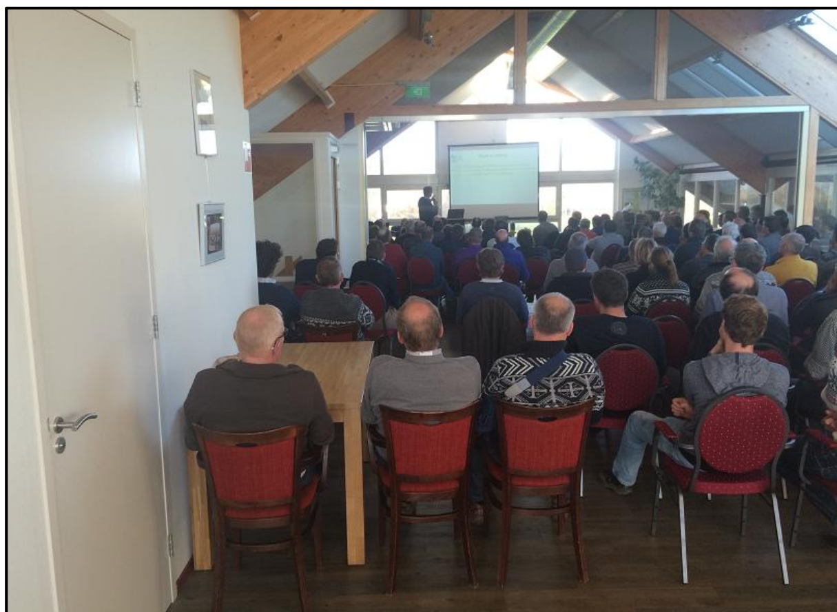
De jaarvergadering in Shortgolf in Swifterbant was weer goed bezocht met 138 aanwezigen.