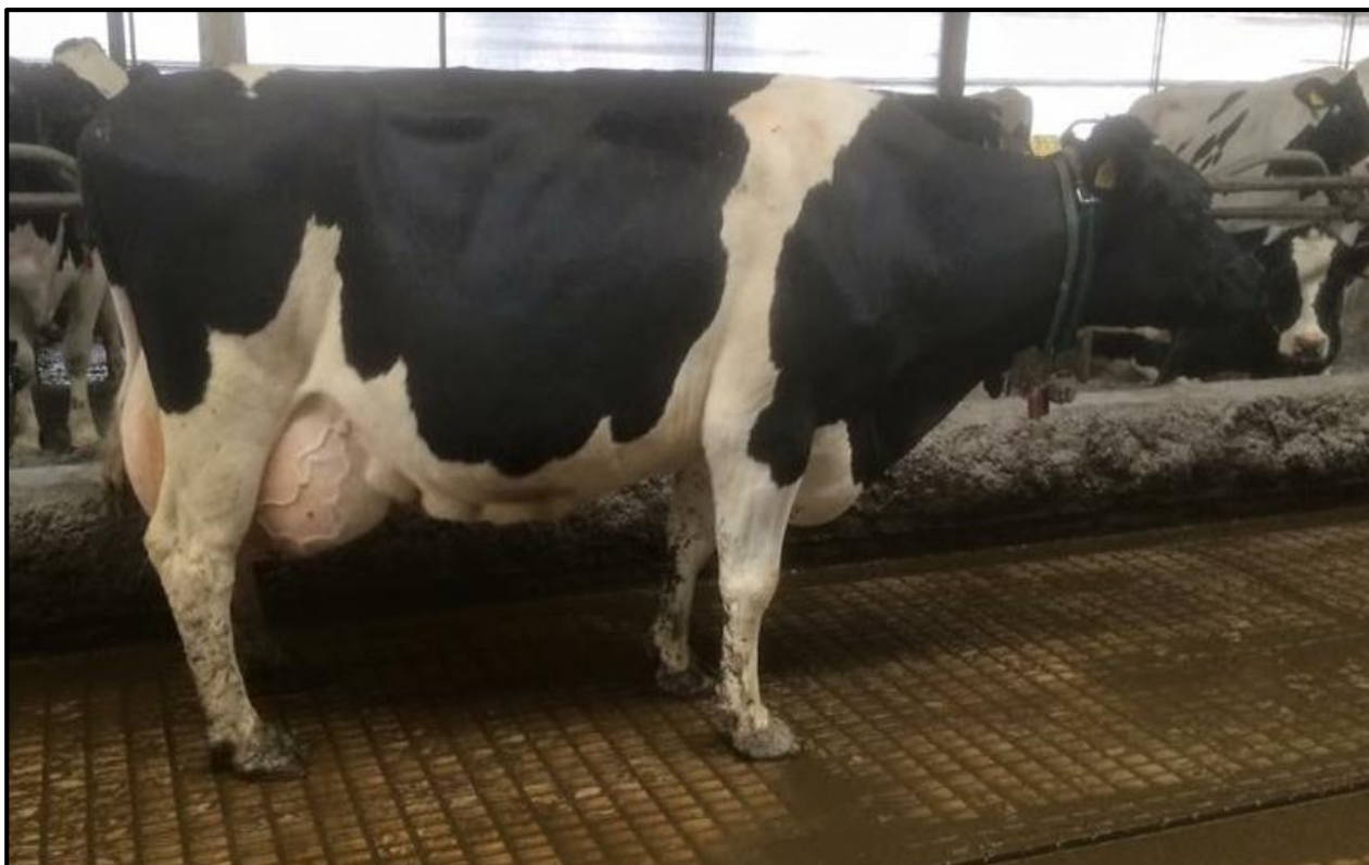
Een 6 e kalfs Triple Threat x Rudolph bij de Familie Mooiman in Westerwijtwerd. LW 105