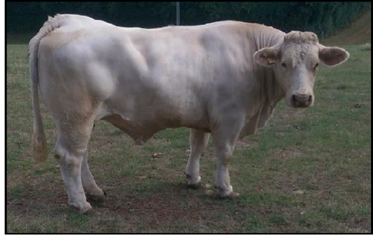
Deze Charolais die 4 keer heeft gekalft maar te weinig melk geeft om een kalf groot te brengen, ook een vleeskoe moet enige dairy kwaliteiten bezitten.

de uitlegpagina staan, zijn tenslotte ook belangrijk voor vleesvee. Ook een moederkoe moet genoeg melk geven voor haar kalf en dus ook dairy kwaliteiten op voldoende niveau bezitten.