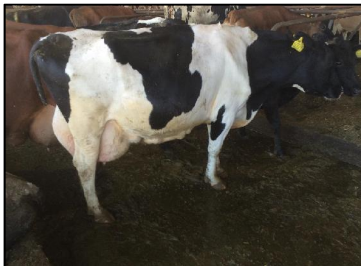
Een Spektrum Peter-dochter.

In het verleden hebben ze meer koeien gekocht, meestal geselecteerd op basis van productie. Ze kwamen erachter dat deze koeien niet konden concurreren met die van henzelf en dat ze het bedrijf eerder verlieten. Dus toen ze koeien nodig hadden omdat de nieuwe stal klaar was, hebben ze het anders gedaan. Ze vroeg naar een selectie van koeien die drachtig waren en goed celgetal. Ze zei dat ze de productie niet hoefde te weten. 'Ik kan zelf wel zien of ze de wil om te melken hebben en ik besluit in een fractie van een seconde of ik de koe goed vind of niet.' Later heeft ze de vader gecontroleerd en vaak waren het goede stieren die ook goede kwaliteiten hadden. Dochters van Lexicon, Othello, O Man, Omax en Leko.