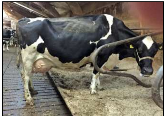
Wibke 9 (v. Bertil x Red Alert) had bij de tweede controle in de vijfde lijst 48,5 kg met 4,7% vet en 3,7% eiwit.