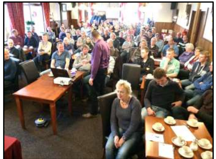
Een afgeladen volle zaal met net genoeg stoelen voor iedereen.

In de omgang met een koppel koeien moeten we ons bewust zijn van de leiders en de volgers in een koppel. Als de leiders in een bepaalde richting gaan, volgt de rest.