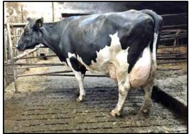
Weitske 400 (Ramos x Taco). De zevendekalfs koe gaf 24 dagen na afkalven 52 kg bij de eerste controle.