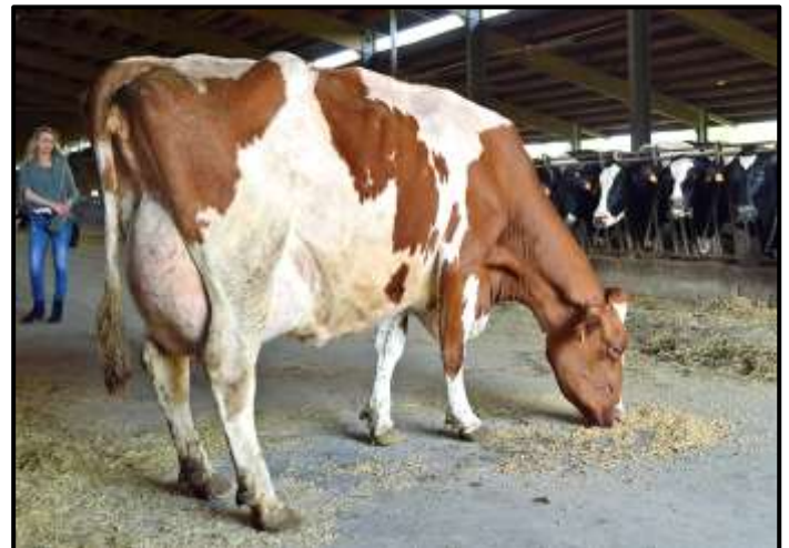
Een Talent x Mr. Burns x Storm bij Zani.

dierenarts en wil alle pinken onder gesekst sperma doen op basis van de Triple-A-codes en misschien maakt hij het zichzelf daardoor niet echt gemakkelijk, maar waar een wil is, is een weg. Het analyseren viel niet mee, als je de pinken door een halve meter mest van maïsstro ziet rennen. Leuke Jeeves-dochters lieten regelmatig wat rondere kwaliteiten zien. Na de pinken nog even tussen de hoog-drachtige vaarzen gekeken en daar kwamen we twee heel beste droge Jesther-dochters tegen, die in dezelfde groep liepen. Ze toonden gigantisch gewelfde ribben en leken makkelijk oud te worden. Waar was hij nog meer goed over te spreken... Ja hoor, dochters van Kian, Ramos en Mtoto. Hoe zou dat komen?! Hopelijk dit voorjaar ook wat oudere koeien bij Lele analyseren.