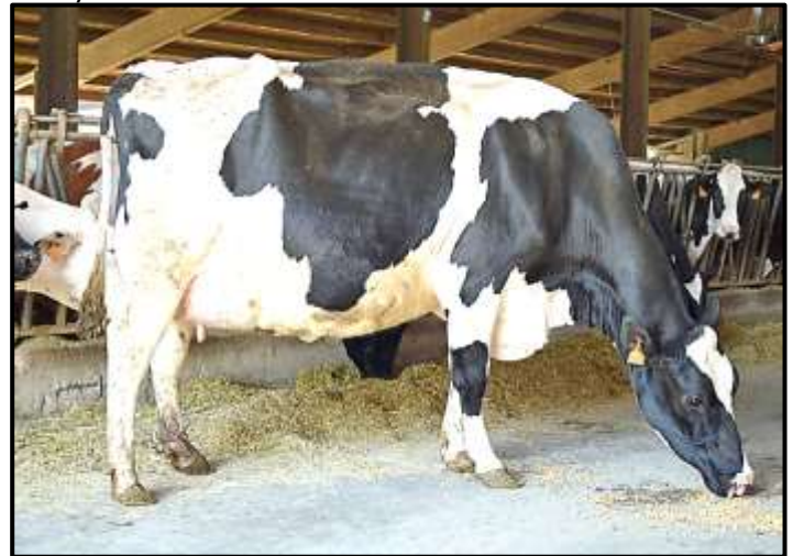
Een Ashlar x Oman x Adam x Emerson bij Zani.