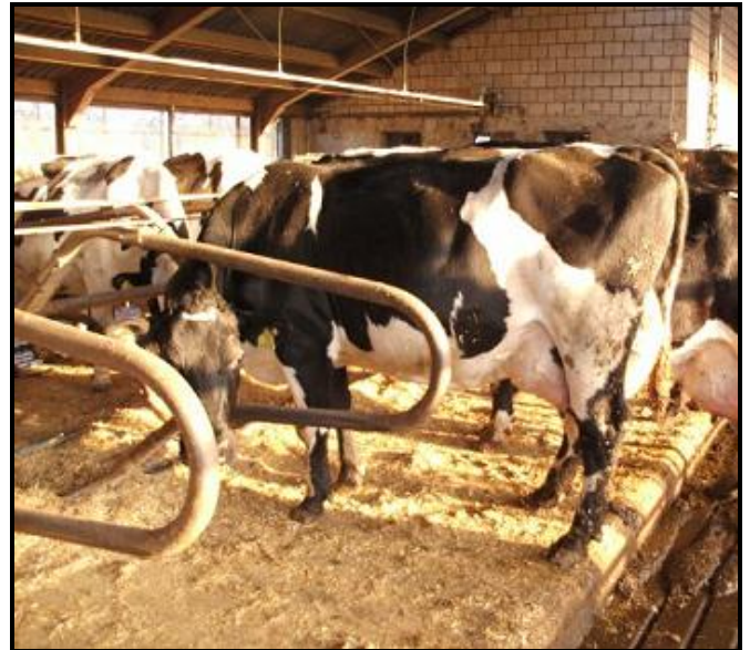
Een mooie complete SRB x HF

erbij. Koeien die ondersteuning nodig hadden in beenwerk werden dikwijls met Brown Swiss geïnsemineerd. Zo ontstond er een soort mix van rassen die elkaar prima aan konden vullen.