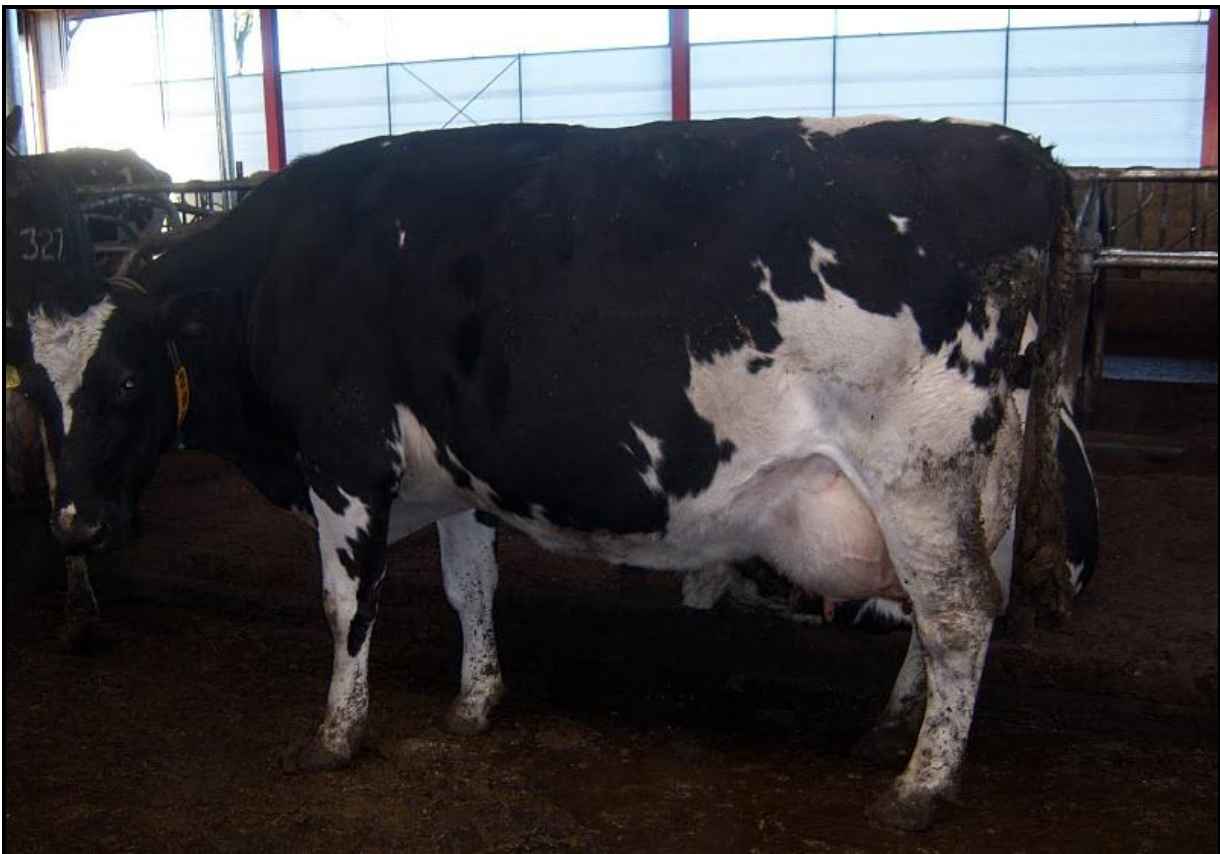
Dit is een dochter van Schothorst Design 3 x Charisma x Archibald x Supreme 112.000 kg, een enorme brede en uitgebalanceerde koe die heel makkelijk produceert. Schothorst Design 3 is een Schoth. Design 1 uit een Storm van 106.000 kg die nog aanwezig is.