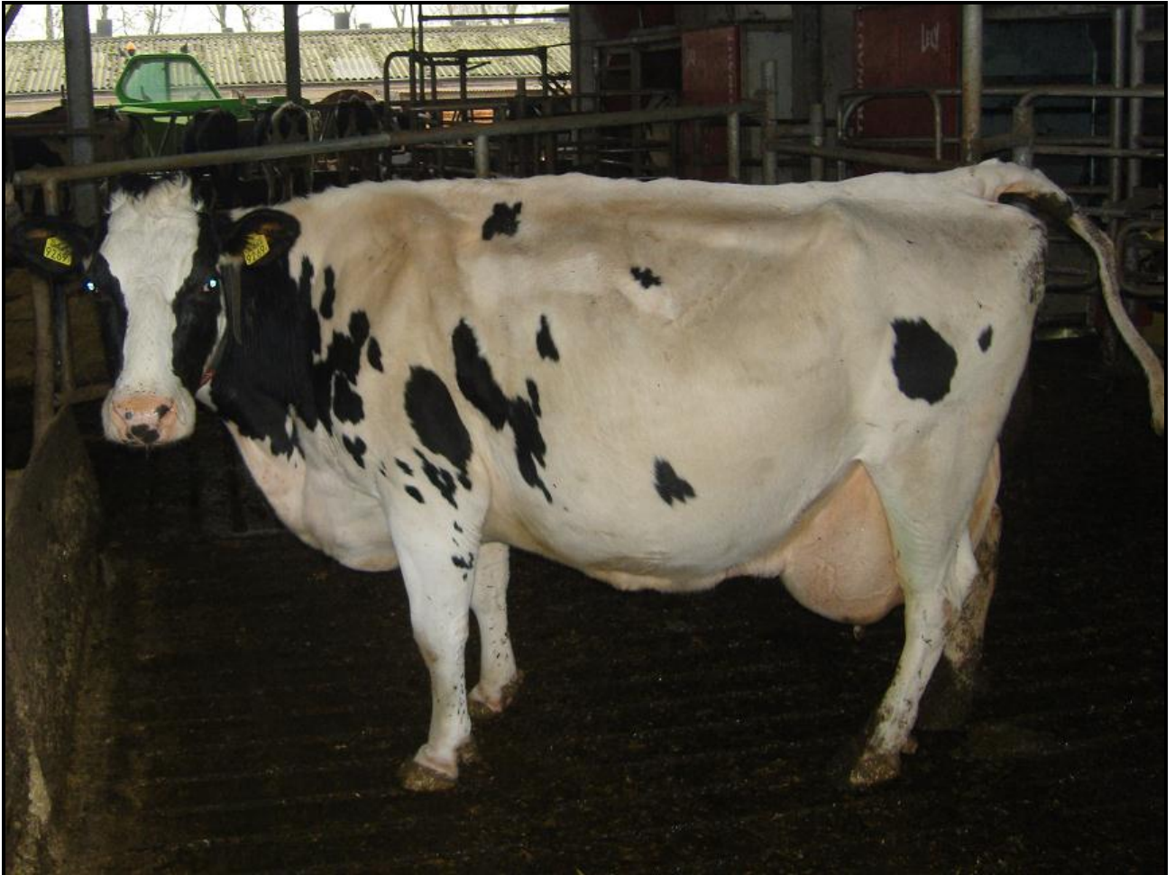
Dit is mijn favoriete koe Agnes 45. Ze is 12 jaar en heeft tot dusverre 76.000 geproduceerd met 5.24% vet en 3.84% eiwit.