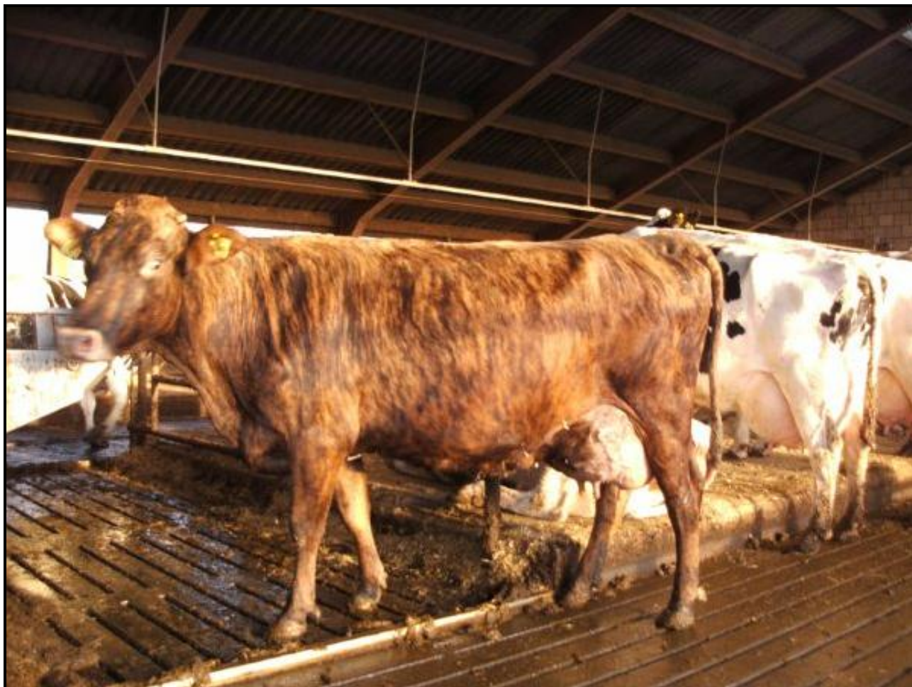
Deze kleurling siert de stal van Freek Essink, niet alleen haar kleur, ook haar soepele uier en harde benen, stevige koten en robuuste, ronde klauwen.