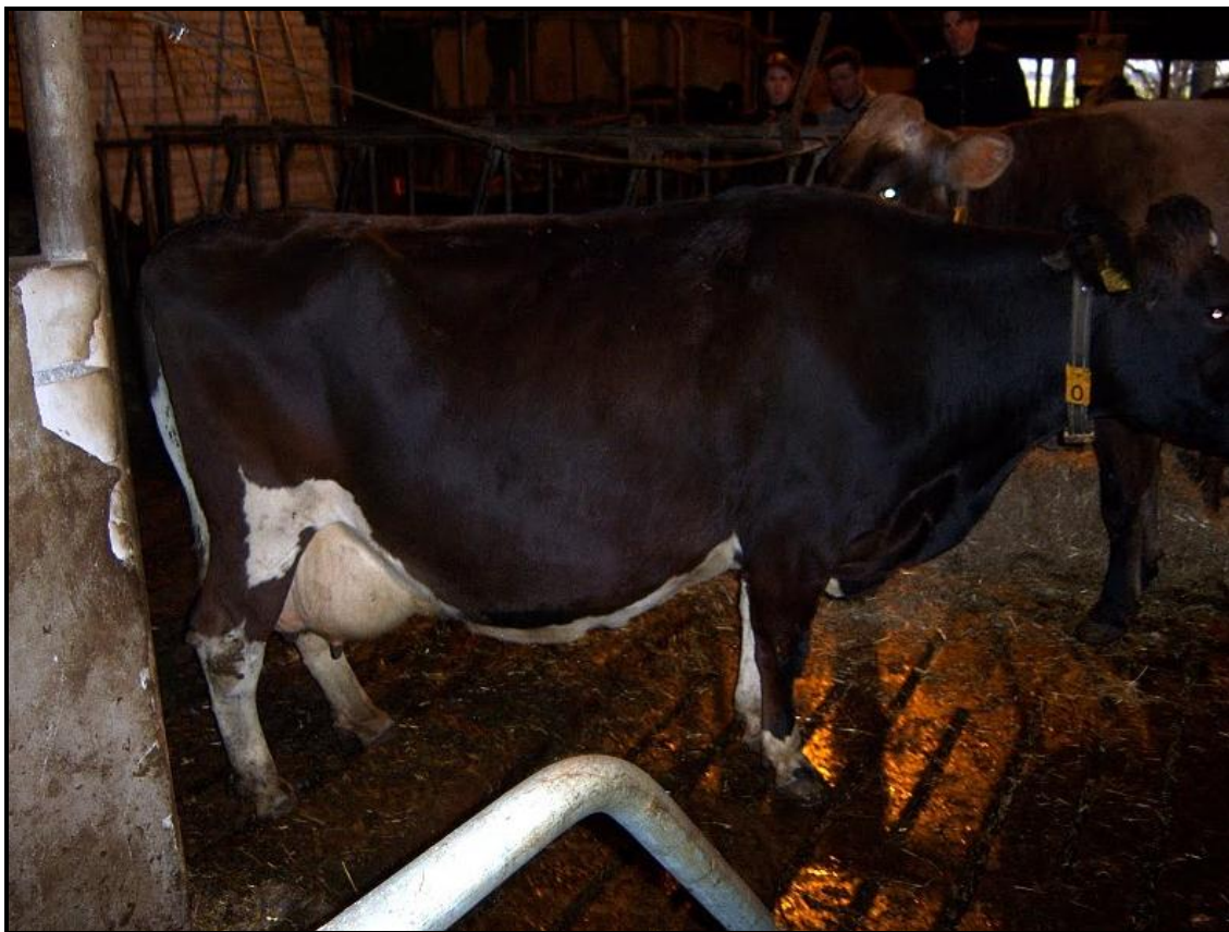
Deze koe geeft in 10 dagen haar eigen lichaamsgewicht in melk. Zo ziet Sierd zijn koeien graag, niet te groot, gewelfde ribben en veel vreetvermogen en veel melk geven naar omvang.