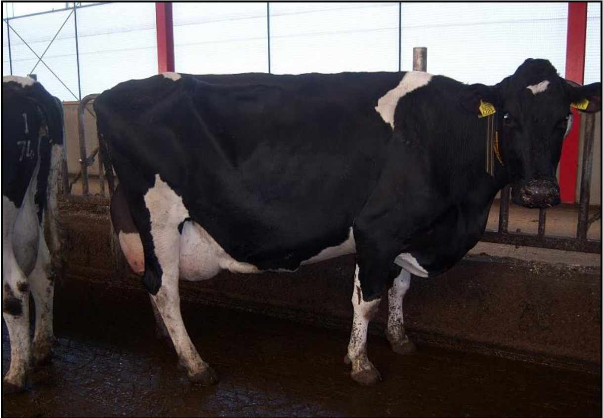
Dit is His 105 een dochter van Schothorst Design 2 x Sunny Boy van de Schothorst. Haar vader is een Design zoon uit een Bell Rex van 160.000 kg/12000 kg v+e x Command x Tops 155.000 kg x Telstar Viking