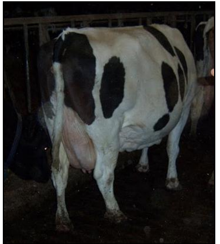
Inmiddels donker geworden lukte het nog om deze mooie witte Bonatus nog op de foto te krijgen bij Gé v/d Broek