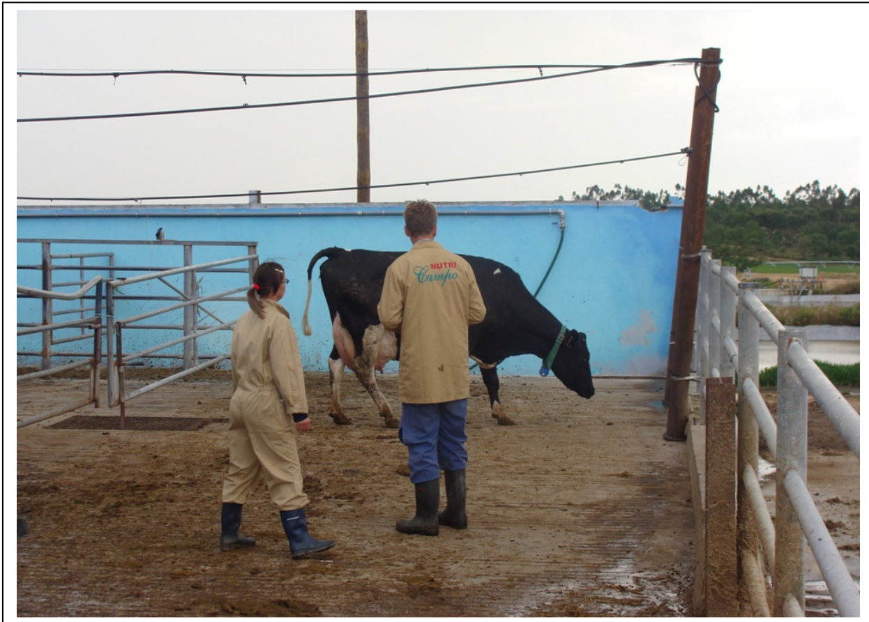
Analyseren op een nieuw Portugees bedrijf met 400 melkkoeien.