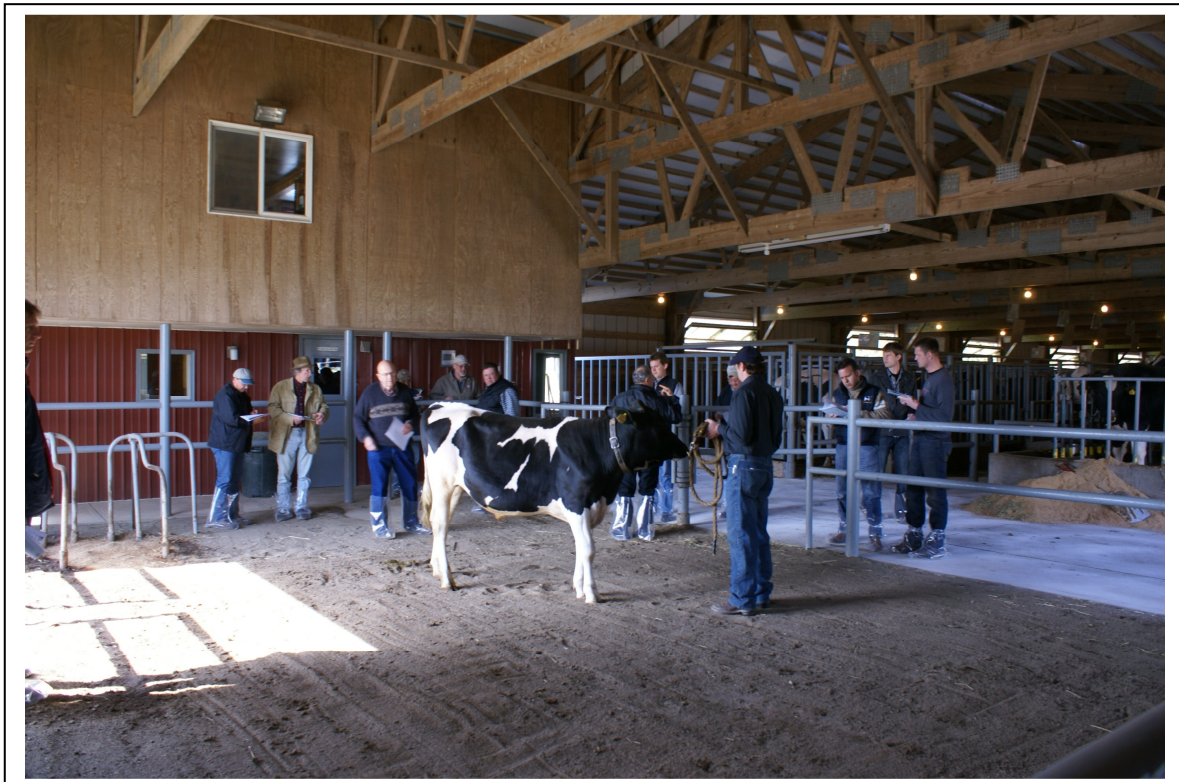
Bij KI Taurus Service werden nog 2 jonge stieren geanalyseerd