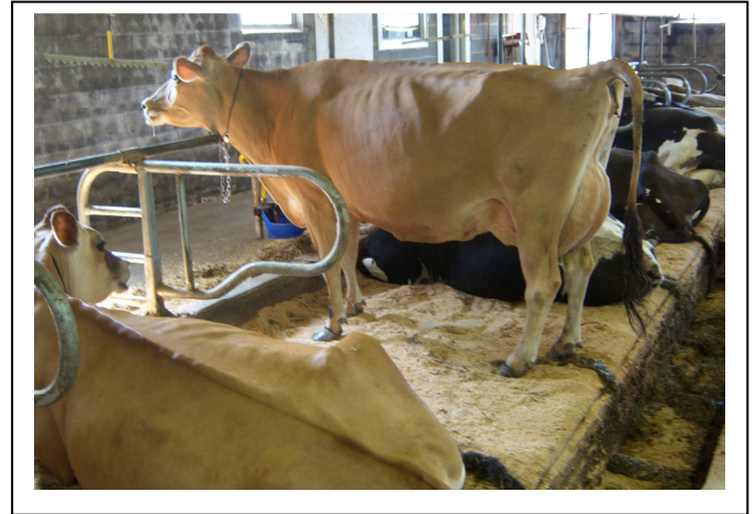
1 van de vele beste jersey in deze stal: Ty-Ly View Counciller Sage. Ruim 10.700 5.8% en 3.8%