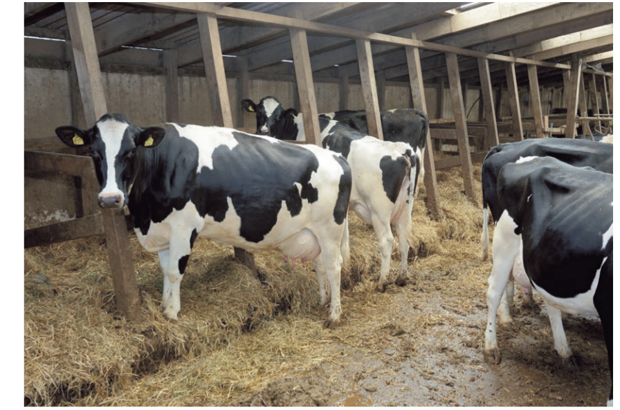
De koeien lopen in een eenvoudige Engelse stal, met stro in de boxen en een dichte vloer. De boxafscheidingen dienen tegelijkertijd als dakondersteuning.

Alle koeien kalven in de maanden september, oktober en november, met een uitloop naar december. „Het voordeel is dat je de hele koppel optimaal kunt voeren en als het heet is, heb je geen verse koeien”, aldus Hayer. „Je kunt je focussen op één fase, er zijn nu bijvoorbeeld geen tochtige koeien, alles is gestandaardiseerd.” Hayer wijst erop dat het na de afkalperiode relatief rustig is, wat handig is met het oog op de voorjaarswerkzaamheden. De verse koeien krijgen een rantsoen verstrekt van hoofdzakelijk GPS (tarwesilage), aangevuld met graskuil, bierbostel en krachtvoer. Per kilo melk krijgt een koe maximaal 250 gram krachtvoer, een kengetal dat de veehouder nauwlettend in de gaten houdt. „Is het lager, dan is de productie niet op peil; is het hoger, dan wordt het te duur en heb je kans op pensverzuring.” Het kengetal wordt elke twee dagen met het ledigen van de tank gecontroleerd. Hayer weet dan exact wat er aan krachtvoer in gegaan is en aan melk uitgekomen is. De tarwesilage wordt tegen het deegrijpe stadium aan geoogst (34 procent droge stof) en wordt in één werkgang gemaaid en ingekuuld. „Ze produceren er goed van; een rantsoen voor verse koeien moet snel zijn”, aldus de veehouder. In januari vervangt