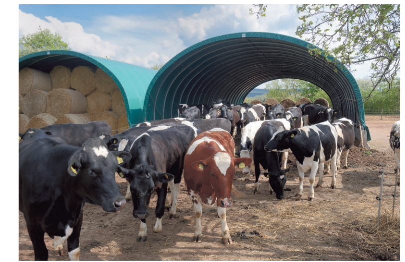
Het jongvee wordt in een eenvoudige compoststal gehuisvest en heeft eveneens een vrije uitloop naar de weide.

Een gevolg van het seizoensgebonden afkalfpatroon is dat de vruchtbaarheid onder controle moet zijn. De afvoer onder de melkgevende dieren mag niet te hoog zijn, maar er mogen ook weinig opfokproblemen zijn, omdat alle dieren op een leeftijd van