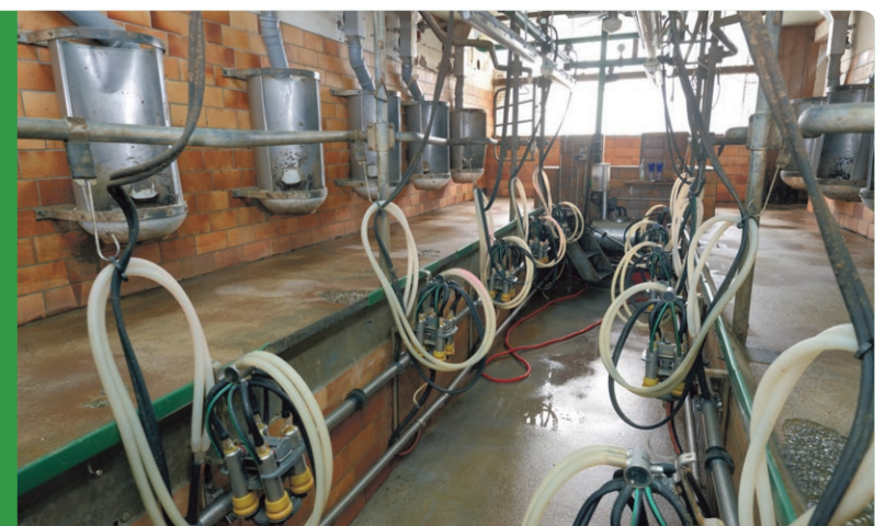
De koeien worden gemolken in een 2 x 5 stands visgraat melkstal.