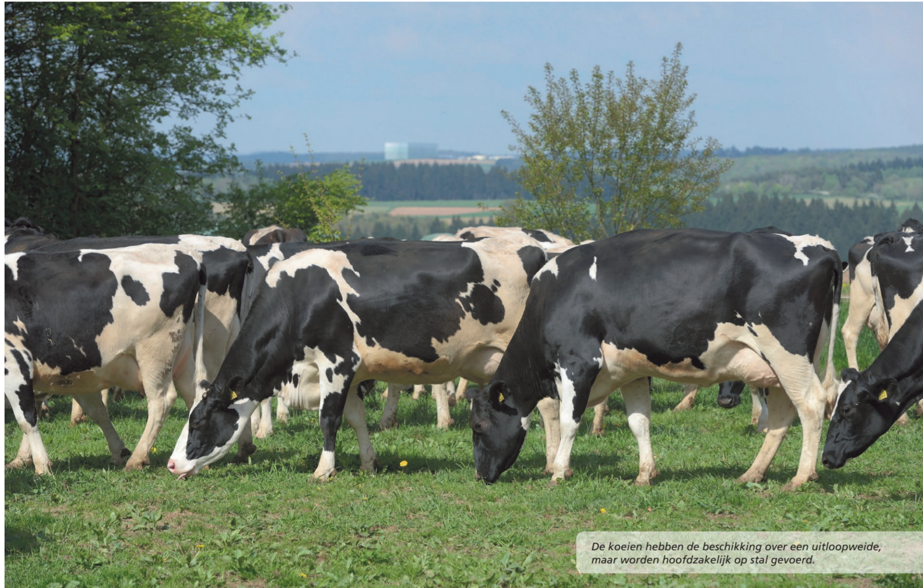
De koeien hebben de beschikking over een uitloopweide, maar worden hoofdzakelijk op stal gevoerd.

‘Weinig problemen en weinig extremen gaan samen’