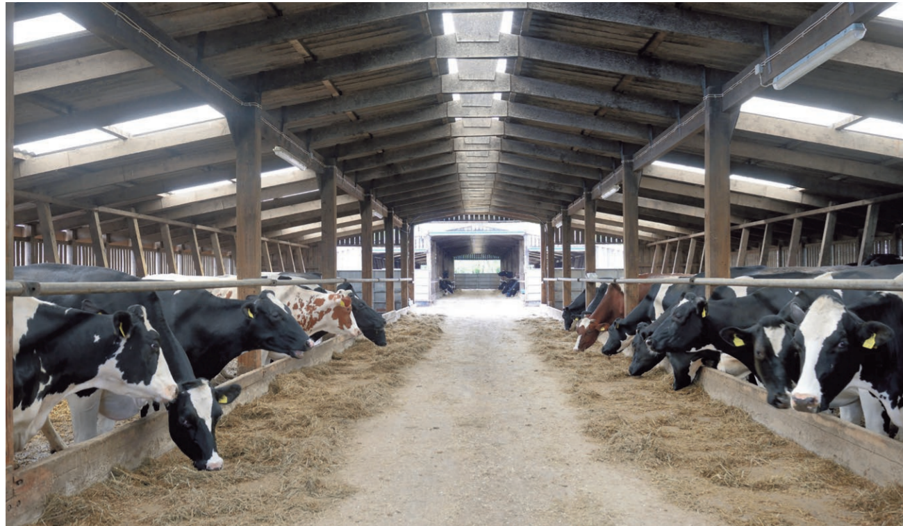
Er zijn twee Engelse stallen in elkaars verlengde geplaatst. Doorgaans staan de metalen deuren aan het eind van de stal open, zodat de koeien via het erf een vrije uitloop naar de weide hebben.